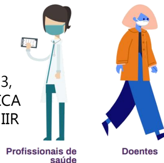
Profissionais de saúde