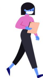
Profissionais que não sendo da saúde estão em contacto frequente com o público.