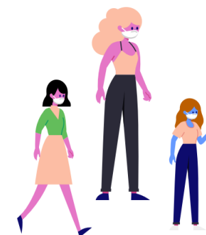
Profissionais que não estejam em teletrabalho ou população em geral para as saídas autorizadas em contexto de confinamento

USA SEMPRE MÁSCARA: PROTEGE-TE A TI E AOS OUTROS